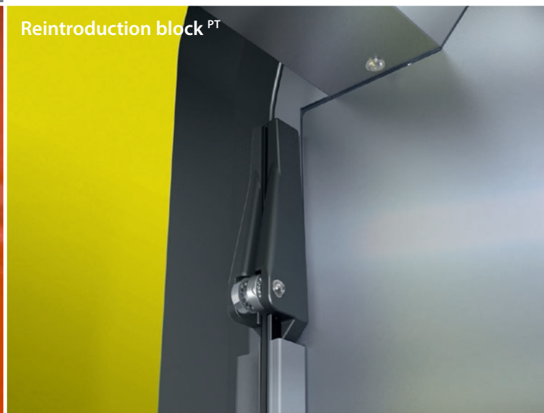
Reintroduction block PT