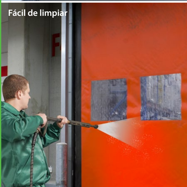
Fácil de limpiar

En los entornos de procesamiento de alimentos, es importante evitar contaminantes como el polvo, la suciedad y las alimañas. Las puertas Dynaco ofrecen la solución perfecta gracias a su alta velocidad y sellado hermético. Dynaco ofrece 2 modelos diferentes, diseñados específicamente para entornos de procesamiento de alimentos: D-311 LF y D-313 LF.