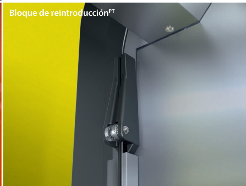
Bloque de reintroducción PT